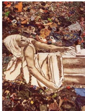
Photograph by Vik Muniz, courtesy of Vik Muniz Studio

http://lewebpedagogique.com/terrarausio/global-trash-une-expo