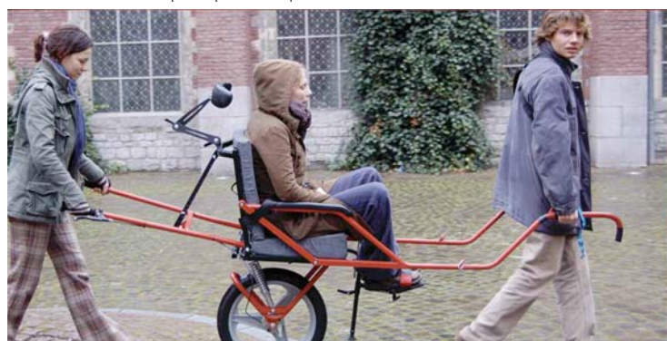
Lors de l'atelier 'Nature pour tous' (Natagora), découverte de fauteuils pour les personnes à mobilité réduite