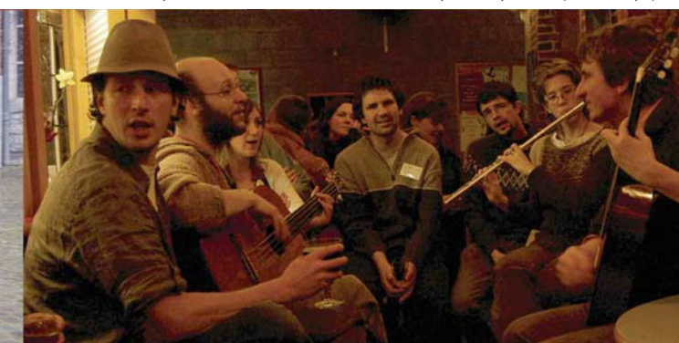
Ambiance fin de soirée