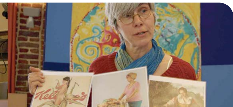
Alimentation et peinture au cœur de l'atelier 'Ceci n'est pas une pomme' (CRIE de Spa)

1 Centre Local de Promotion de la Santé (CLPS) de Charleroi-Thuin, Centre d'Initiation et de Formation à l'Environnement de Comblain-au-Pont (CIFEC), Roule ta Bille, GREEN Belgium, Institut d'Eco-pédagogie et CRIE d'Harchies.